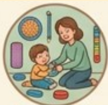
НАВЧАЛЬНО- РЕАБІЛІТАЦІЙНИЙ ЦЕНТР